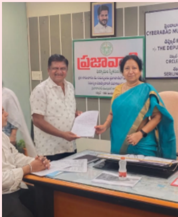
మేషల్, మే 25 (హంసకలం వార్డు)