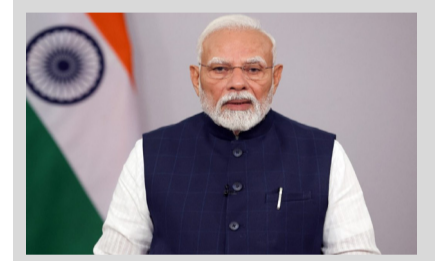
అధికారం దక్కితే జీబులు నింపుకోవడమే ఈసారి కేరళలో ఎన్డీఎ విజయం తథ్యం యువత, మహిళలు, రైతులు ఆదరిస్తున్నారు పాలక్కాడ్ బహిరంగ సభలో ప్రధాని ప్రసంగం

ఎల్డీఎఫ్, యూడీఎఫ్ కూటమిలపై మోదీ ధ్వజం అధికారం దక్కితే జీబులు నింపుకోవడమే ఈసారి కేరళలో ఎన్డీఎ విజయం తథ్యం యువత, మహిళలు, రైతులు ఆదరిస్తున్నారు పాలక్కాడ్ బహిరంగ సభలో ప్రధాని ప్రసంగం సీపీఎం నేతృత్వంలోని ఎల్డీఎఫ్, కాంగ్రెస్ నేతృత్వంలోని యూడీఎఫ్ కేరళను విచ్చలవిడిగా లాటీ చేశాయని ప్రధాని నరేంద్ర మోదీ నిప్పులు చెరిగారు. "రాష్ట్రంలో బీజేపీ నేతృత్వంలోని ఎన్డీయే అసలైన ఎ-టీమ్. అంతే తప్ప" విగతా 2లో