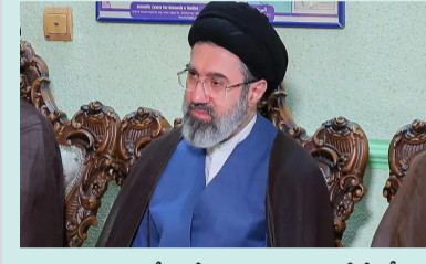
ఇరాన్ సుప్రీం లీడర్ మోజ్తాబా ఖమేనీ కీలక ప్రకటన విడుదల చేశారు. అమెరికా చేస్తున్న దురాక్రమణ

మోజ్తాబా ఖమేనీ లేఖ విడుదల ఇరాన్ సుప్రీం లీడర్ మోజ్తాబా ఖమేనీ కీలక ప్రకటన విడుదల చేశారు. అమెరికా చేస్తున్న దురాక్రమణ ఇండించి ఇరాన్ కు మద్దతుగా నిలిచినందుకు ఇరాన్ కు కృతజ్ఞతలు తెలిపారు. ఇరాన్ సుప్రీం లీడర్ మోజ్తాబా ఖమేనీ కీలక ప్రకటన విడుదల చేశారు. అమెరికా చేస్తున్న దురాక్రమణ