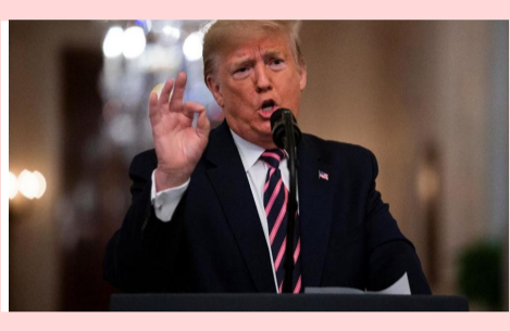
అమెరికా అధ్యక్షుడు డొనాల్డ్ ట్రంప్ సంచలన నిర్ణయం తీసుకోనున్నట్లు సమాచారం. అదే జరిగితే, ట్రంప్ నిపుతో చెలాగటం ఆడినట్లే అవుతుందని విశ్లేషకులు

400 కేజీల యురేనియం ఎత్తుకొచ్చేయండి? : ట్రంప్ అమెరికా అధ్యక్షుడు డొనాల్డ్ ట్రంప్ సంచలన నిర్ణయం తీసుకోనున్నట్లు సమాచారం. అదే జరిగితే, ట్రంప్ నిపుతో చెలాగటం ఆడినట్లే అవుతుందని విశ్లేషకులు వ్యాఖ్యానిస్తున్నారు. ఇరాన్ అణు బాంబులు చేపట్టకూడదని ఆయన పలు మార్లు స్పష్టంగా చెప్పారు. అమెరికా అధ్యక్షుడు డొనాల్డ్ ట్రంప్ సంచలన నిర్ణయం తీసుకోనున్నట్లు సమాచారం. అదే జరిగితే, ట్రంప్ నిపుతో చెలాగటం ఆడినట్లే అవుతుందని విశ్లేషకులు