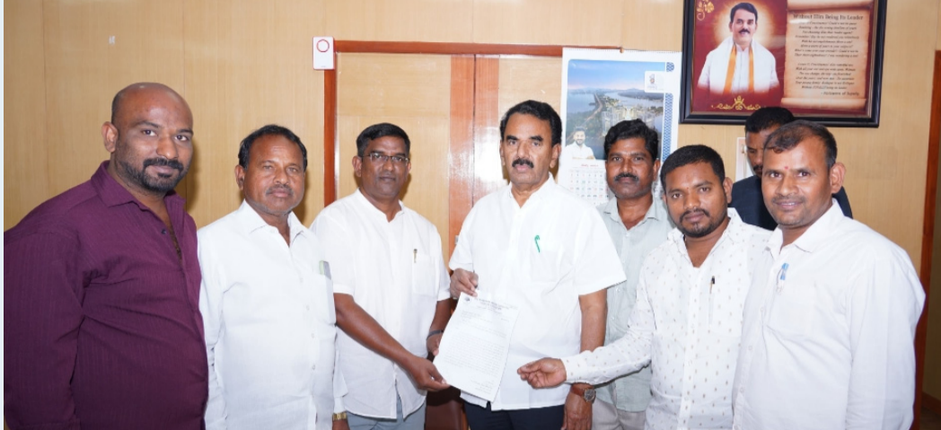
అత్యధికంగా నివాసం ఉంటున్నారని పట్టణం పాలమూరు బడ్జెట్ల సంక్షేమ సంఘం సభ్యులు మంత్రి దృష్టికి తీసుకు వెళ్లారు. ఈ కార్యక్రమంలో పట్టణం పాలమూరు బడ్జెట్ల సంక్షేమ సంఘం

హాస్ కలం వార్త, తెలుగు దినపత్రిక 31- మార్చి -26: రాష్ట్ర సాంస్కృతిక, పర్యాటక, ఎన్ట్రెజ్ శాఖా మంత్రి వర్మల పెద్దలు జాపల్లి కృష్ణారావు కి పట్టణం పాలమూరు బడ్జెట్ల సంక్షేమ సంఘం సభ్యులు మర్యాద పూర్వకంగా కలవడం జరిగింది. హైదరాబాద్ మహానగరంలో కొత్తగా ఏర్పాటు అయిన గ్రేటర్ హైదరాబాద్ మున్సిపల్ కార్పొరేషన్, మల్కాజ్గిరి మున్సిపల్ కార్పొరేషన్, సైబరాబాద్ మున్సిపల్ కార్పొరేషన్ పరిధిలో అత్యధిక పాలమూరు వాసులు నివాసం ఉంటున్న ప్రాంతాలలో పాలమూరు బడ్జెట్లకు కార్పొరేటర్ టికెట్ కేటాయించి రాజకీయంగా ఎదిగేలా సహకరించాలని కోరారు. కొన్ని దశాబ్దాలుగా హైదరాబాద్ మహా నగర నిర్మాణంలో, అభివృద్ధిలో పాలమూరు వాసులు, కార్మికులు అందించిన సేవలు, పాలమూరు వాసుల పాత్ర ఎంతోనైనా మంత్రి జాపల్లి కృష్ణారావు అన్నారు. శేరిలింగంపల్లి నియోజక వర్గంలో శంషుగూడ, అల్లినీ కాల్ని, వెంకటేశ్వర నగర్, కూకట్ పల్లి నియోజక వర్గంలో బాలానగర్, జూబ్లీహిల్స్ నియోజకవర్గంలో బోరబండ, రెవెన్యూ నగర్ డివిజన్లలో పాలమూరు వాసులు