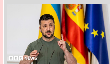
రష్యాలోని అత్యంత కీలకమైన ఉస్ట్-లుగా

ఇంధన కేంద్రాలపై దాడులు ఆపితే, రష్యా చమురు కేంద్రాలపై దాడులు ఆపేస్తాం రష్యాలోని అత్యంత కీలకమైన ఉస్ట్-లుగా చమురు ఎగుమతి టెర్మినల్లపై ఉక్రెయిన్ మరోసారి డ్రోన్లతో విరుచుకుపడింది. గత వారం రోజుల్లో ఈ కేంద్రంపై దాడి జరగడం ఇది మూడోసారి. రష్యాలోని అత్యంత కీలకమైన ఉస్ట్-లుగా