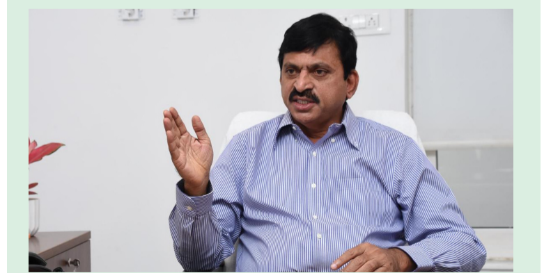
బీఆర్ఎస్ హయాంలోనే దోపిడీ

రాయల్ కింద ప్రభుత్వానికి రూ.2 కోట్లపైగా చెల్లింపులు కూడా జరిగాయి బీఆర్ఎస్ హయాంలోనే దోపిడీ బీఆర్ఎస్ హయాంలో జరిగిన దోపిడీని ప్రజల ముందు పెట్టేందుకు మంత్రి పొంగులేటి శ్రీనివాస్ రెడ్డి సన్నద్ధమవుతున్నారు. గత పదేళ్లలో ధరణి, మైనింగ్ పేరుతో జరిగిన అక్రమాలు, వాటి వెనక ఉన్న వ్యక్తుల ప్రమేయాన్ని ఆధారాలతో సహా ప్రజలకు వివరించేందుకు సిద్ధమవుతున్నట్లు మంత్రి సన్నిహితుల వద్ద ప్రస్తావించారు. విగతా 2లో