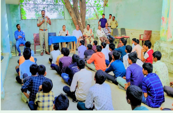
సదపదం (డ్రంక్ అండ్ డ్రైవ్), డ్రైవింగ్ సమయంలో మొబైల్ ఫోన్ వినియోగించడం వంటి ప్రమాదకర అలవాట్లు ప్రాణాపాయానికి దారితీస్తున్నాయి హెచ్చరించారు. షైబర్ నేరాల పట్ల కూడా విద్యార్థులు అప్రమత్తంగా ఉండాలని సూచించారు. అనుమానాస్పద