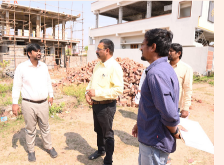
మున్సిపల్ పరిధిలోని ఇంటి పన్ను, ఇతర పన్నులు 100 శాతం పనులు చేసే విధంగా అధికారులు పర్యవేక్షించాలని సూచించారు.మున్సిపల్ పరిధిలోని డంపింగ్ యార్డును సందర్శించి అధికారులకు పలు సూచనలు చేశారు.నివాసాల నుండి సేకరించిన చెత్తలో ఉపయోగకరమైన వాటిని వేరుచేసి సెగ్రిగేషన్ షెడ్ కు తరలించాలని తెలిపారు.ఈ కార్యక్రమంలో సంబంధిత అధికారులు తదితరులు పాల్గొన్నారు.