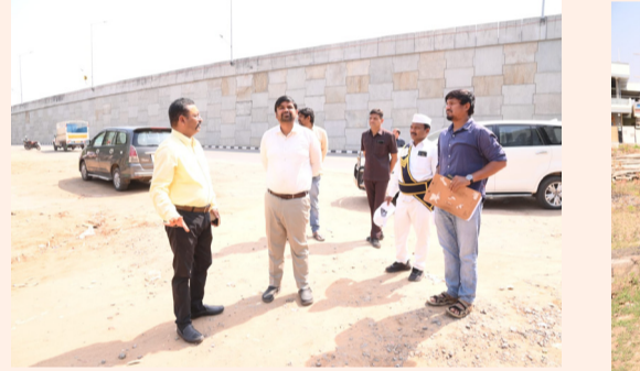
ఎప్పటికప్పుడు శుభ్రపరచి బ్లీచింగ్ చేయాలని తెలిపారు.ప్రతి రోజు ప్రతి ఇంటి నుండి తడి,పొడి చెత్తలను వేరువేరుగా సేకరించాలని,మున్సిపల్ పరిధిలోని అన్ని వార్డులు శుభ్రంగా ఉండేలా చర్యలు తీసుకోవాలని తెలిపారు.ఇందిరమ్మ ఇండ్ల పథకం లబ్ధిదారులు ఇండ్ల నిర్మాణ పనులను నిబంధనలకు లోబడి చేపట్టాలి అవగాహన కల్పించాలని,నిర్మాణ పనులను వేగవంతం చేసి త్వరగా పూర్తి చేసి విధంగా అధికారులు చర్యలు తీసుకోవాలని తెలిపారు.

మంచిర్యాల,హంస కలం వార్డు, తెలుగు దినపత్రిక 26- మార్చి -26: జాతీయ రహదారి 63 విస్తరణలో ఎలాంటి ఇబ్బందులు లేకుండా చర్యలు తీసుకోవాలని వేగవంతం చేయాలని జిల్లా కలెక్టర్ కుమార్ దీపక్ అన్నారు.గురువారం జిల్లాలోని మందమిరి మండలం తిమ్మాపూర్ ప్రాంతంలో ఆర్కాడ్ నుండి చంద్రాపూర్ జాతీయ రహదారి 63 పనులను మండల తహసీల్దార్ సతీష్ తో కలిసి పరిశీలించారు. ఈ సందర్భంగా జిల్లా కలెక్టర్ మాట్లాడుతూ.. అభివృద్ధిలో భాగంగా చేపట్టిన జాతీయ రహదారి విస్తరణ పనులు ఎలాంటి ఇబ్బందులు లేకుండా జరిగే విధంగా అధికారులు చర్యలు తీసుకోవాలని తెలిపారు.అవతరం మందమిరి మున్సిపల్ పరిధిలో కొనసాగుతున్న 99 రోజుల ప్రజా పాలన ప్రగతి ప్రజాళిక కార్యక్రమం అమలు తీరును మండల తహసీల్దార్ సతీష్,మున్సిపల్ కమిషనర్ రాజులింగం తో కలిసి పరిశీలించారు.ప్రభుత్వం ప్రతిష్ఠాత్మకంగా చేపట్టిన ప్రజాపాలన ప్రగతి ప్రజాళికా కార్యక్రమంలో భాగంగా పారిశుధ్య నిర్వహణ పకడ్బందీగా చేపట్టాలని,అంతర్గత రహదారులు,మురుగు కాలువలను