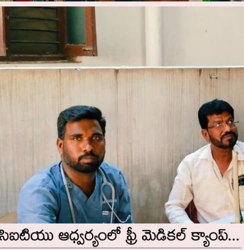
సిబిటియూ ఆధ్వర్యంలో శ్రీ మెడికల్ క్యాంప్...