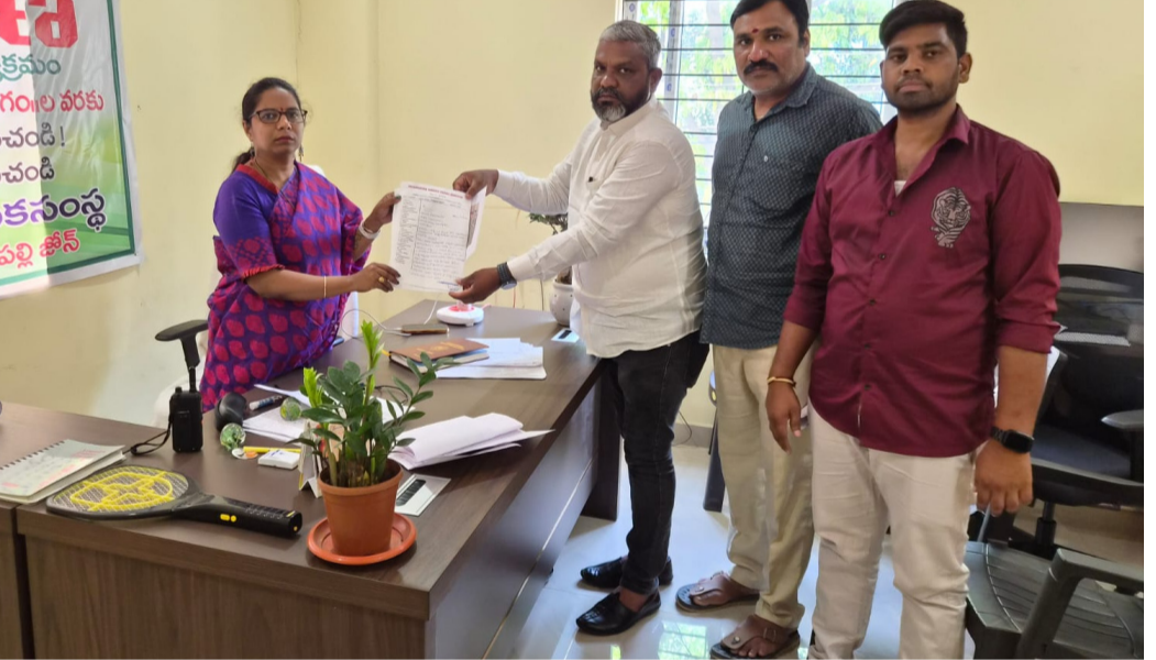
హంస కలం వార్త, తెలంగాణ దినపత్రిక 23- మార్చి -26: మానాసిక్ మున్సిపల్ ఆఫీస్ లో జరిగిన ప్రజా వాణి కార్యక్రమంలో