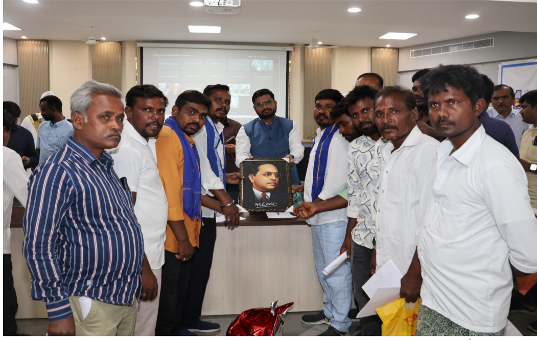
అసెస్మెంట్ భూములు, భూదాన్ భూములు, చాలా వరకు అన్యాయం అయ్యాయి ఇవి తహసీల్దార్ ల ప్రయోజనాలకోసం జాతుగుతున్నాయి జిల్లా మొత్తం ఎన్ని భూములు ఉన్నాయో అన్నిటిని ప్రక్షాళన చేయాలి పేదలకు ఇచ్చిన భూములు అన్యాయం అయ్యాయి కావన ప్రక్షాళన చేసి వారికి చేరాలి చర్యలు తీసుకోవాలి. జిల్లాలో అక్షరాస్యత 49% కాక ఉన్నది, ఇక్కడ ప్రభుత్వ పాఠశాలలో పని చేసే ఉపాధ్యాయులు రియల్ ఎస్టేట్ మరియు అనేక వ?