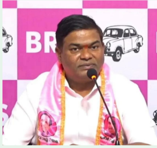
గ్యారంటీలను అమలు చేయకుండా తెలంగాణను ఆగం చేశారని