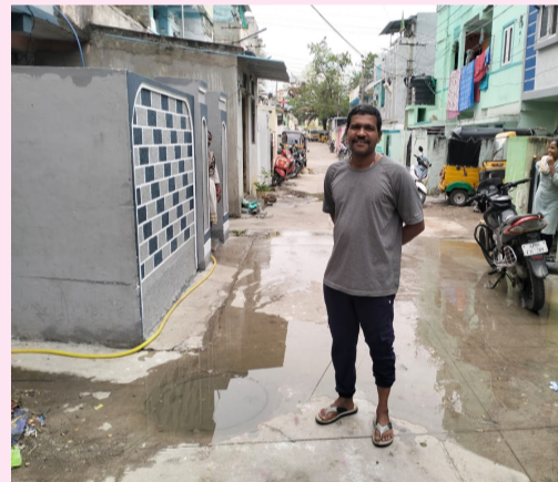
అప్పుడు ఇక్కడ శ్యామ్ తీసుకోలేని పరిస్థితి ఉందని వాపోతున్నారు.మరికీ నీరు కానీలో రోడ్డుపైనే పొంగి పొద్దుతూ ఉండటం వలన రోమలు, పండులు, సైర వికారం చేయడం వల్ల

-పట్టించుకోని మున్సిపల్ అధికారులు. -తీవ్రమైన దుర్గంధంతో ఇక్కడో ఉండలేమంటూ స్థానికులు ఆవేదన.