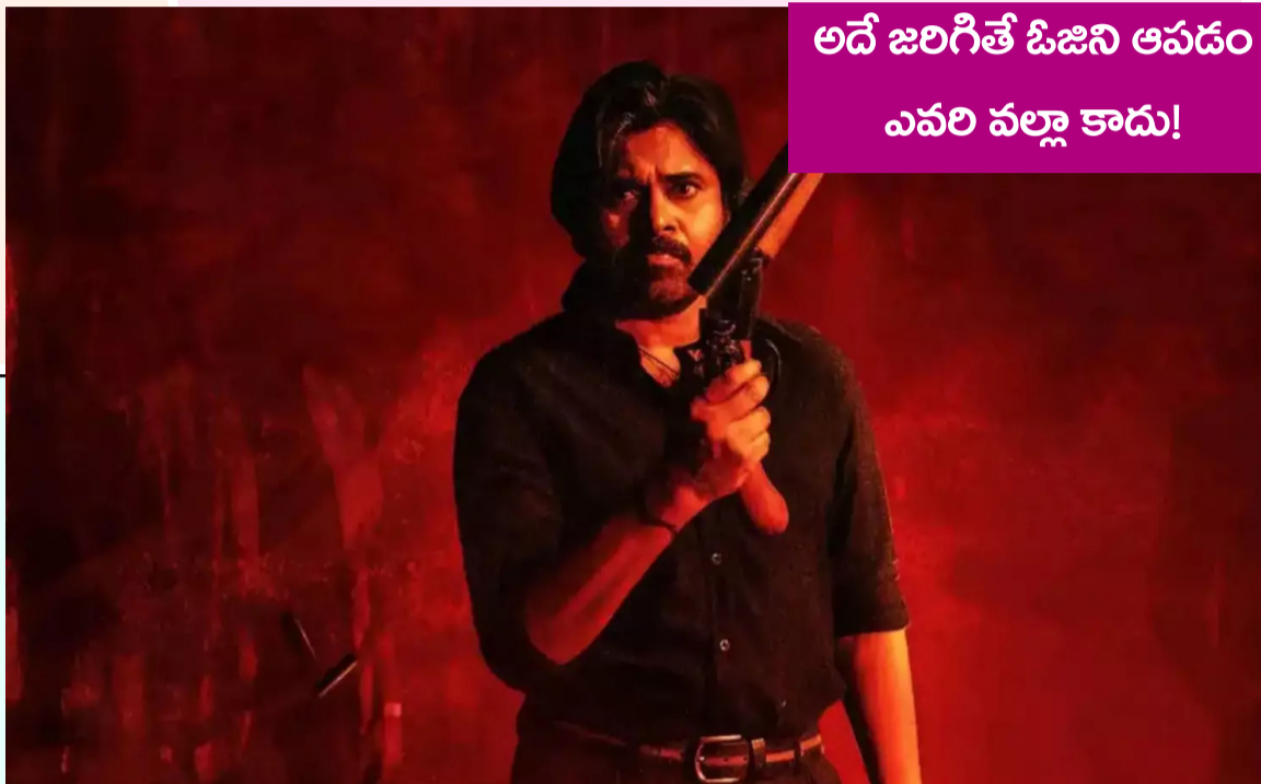
అదే జరిగితే ఓజీని ఆపడం ఎవరి వల్లా కాదు!