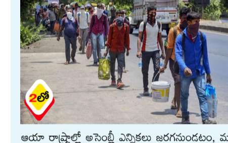
అయో రాష్ట్రాల్లో అసెంబ్లీ ఎన్నికల జరగనుండటం, మరోవైపు రంజన్ పండుగ