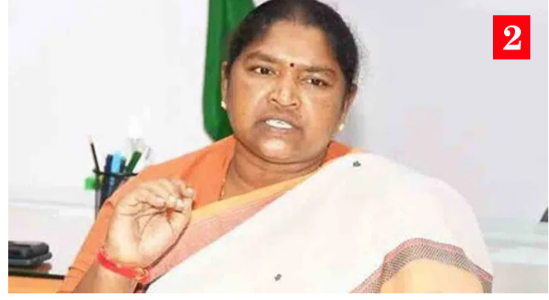
ముందంజలో ఉన్న మహిళా నాయకులను ఒక వేదికపైకి తీసుకువచ్చిన

భారత రాజ్యాంగం కల్పించిన అవకాశాల వల్లే ఈ మార్పు సాధ్యమైంది అదివాసీ కుటుంబం నుంచి ప్రజాసేవలోకి..