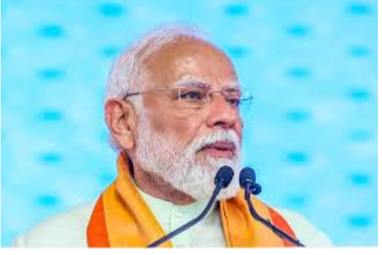
రెండు రోజుల రాష్ట్రాల వర్తకుల ముగింపుకుని ఢిల్లీకి రాగానే ప్రధాని నరేంద్ర మోదీ ఆదివారం రాత్రి అత్యవసర సమావేశం నిర్వహించనున్నారు. పశ్చిమాసియాలో యుద్ధ మేఘాలు కమ్మకున్న నేపథ్యంలో.. దేశ - మిగతా 2 లో