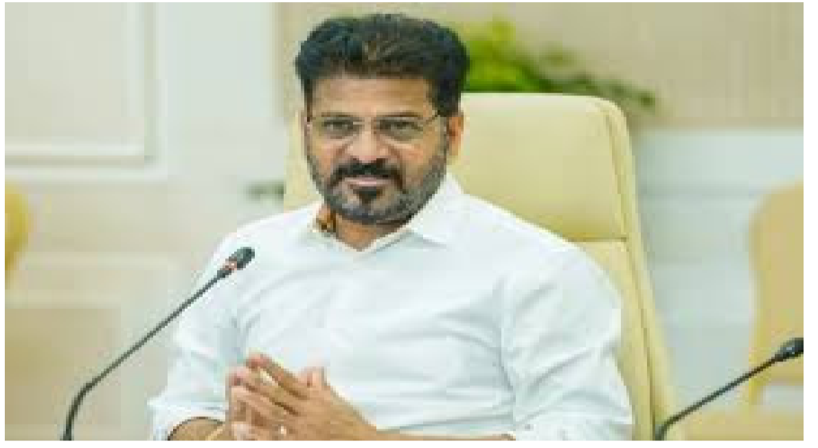
దేశాల్లోని పరిస్థితులను తెలంగాణ ప్రభుత్వం నిశితంగా గమనిస్తోందని సీఎం రేవంత్ రెడ్డి తెలిపారు. అక్కడి తెలుగువారు భారత రాయబార