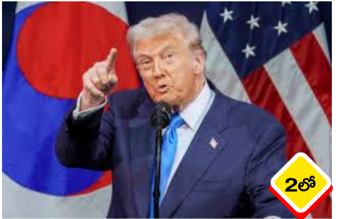
"ఒక్క దెబ్బకు 48 మంది ఇరాన్ అగ్రనేతలను లేపేశాం.. ఇది మాకు అద్భుత విజయం" అంటూ అమెరికా అధ్యక్షుడు డొనాల్డ్ ట్రంప్ తాజాగా ప్రకటన చేశారు. మధ్యప్రాచ్యంలో ఉద్రిక్తతలు తారాస్థాయికి చేరాయి.