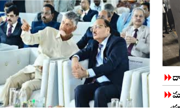
శంకుస్థాపన జరిగింది. రాష్ట్రంలో న్యాయమూర్తులకు అత్యున్నత ప్రమాణాలతో కూడిన శిక్షణ అందించే లక్ష్యంతో, సుమారు రూ.165 కోట్ల భారీ వ్యయంతో ఈ అకాడమీని నిర్మిస్తున్నారు. మొత్తం 4.83 ఎకరాల విస్తీర్ణంలో, 2.05 లక్షల చదరపు అడుగుల నిర్మాణ వైశాల్యంతో ఈ ప్రాజెక్టును చేపడుతున్నారు. అమరావతిలోని ఏపీ హైకోర్టుకు కేవలం 5.7 కిలోమీటర్ల దూరంలో, 50 మీటర్ల వెడల్పు కలిగిన రహదారి వక్కన ఈ అకాడమీని ఏర్పాటు చేస్తుండటంతో దీనికి అద్భుతమైన కన్సైటివ్ ఉండనుంది. భవిష్యత్తు అవసరాలను దృష్టిలో ఉంచుకుని, ఒకేసారి 120 మంది ట్రైని - మిగతా 2 లో