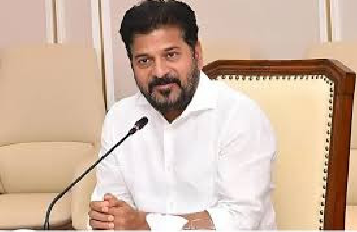
నమయంలో అక్కడి నిర్మాణాల స్థితిని తెలియజేయకపోవడాన్ని ప్రశ్నించారు. జలమండలికి ఈ భూకేటాయింపులను రద్దు చేసి, శారదా పీఠానికి ఆ భూముల కొనసాగింపు ఆదేశించారు. శానిటేషన్ సువిధి పుడ్ సేస్తే వరకు... (ఫ్రీట్ లైట్) సువిధి వారల్ హార్నిస్టింగ్ వరకు - మిగతా 2 లో