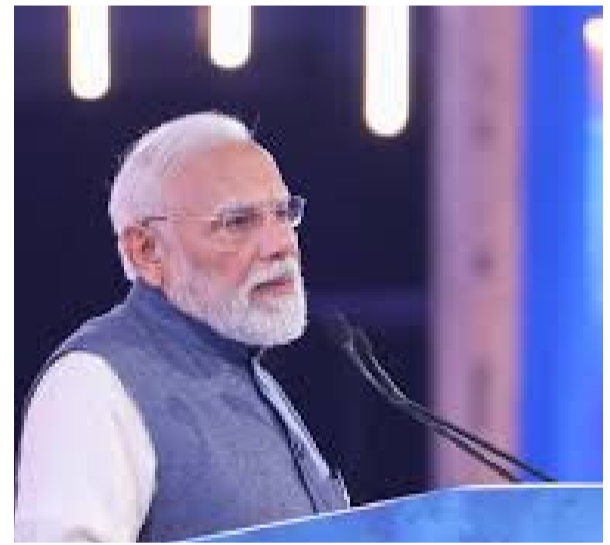
చేశారు. ఓ బాణసంచా తయారీ కర్మాగారంలో ప్రమాదపశాత్తు జరిగిన పేలుడు ఘటనలో ప్రాణనష్టం సంభవించడం పట్ల ఆయన విచారం వ్యక్తం చేశారు. ఈ ఘటన తనను ఎంతగానో కలచివేసిందని పేర్కొన్నారు. ఈ మేరకు ప్రధాని మోదీ శనివారం ఒక ప్రకటన విడుదల చేశారు. "కాకినాడ జిల్లాలోని బాణసంచా కర్మాగారంలో ప్రమాదపశాత్తు జరిగిన పేలుడులో ప్రాణనష్టం సంభవించడం - మిగతా 2 లో