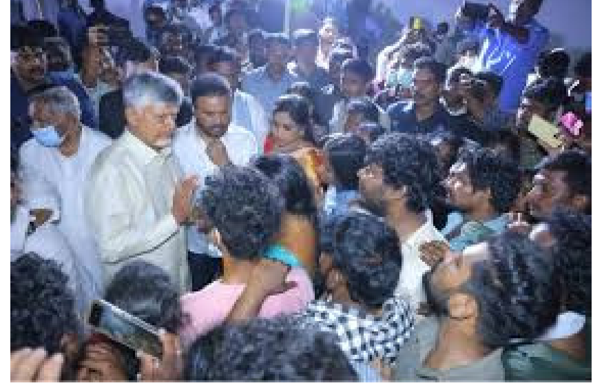
బాణసంచా పేలుడు ఘటన రాష్ట్రవ్యాప్తంగా తీవ్ర విషాదాన్ని నింపింది. ఈ ప్రమాదంలో ప్రాణాలు కోల్పోయిన వారి కుటుంబాలను, గాయపడిన వారిని ఏపీ ముఖ్యమంత్రి చంద్రబాబు స్వయంగా పరామర్శించారు. శనివారం ఆయన బాధితులను ఓదార్చి, వారికి ప్రభుత్వం అండగా ఉంటుందని భరోసా ఇచ్చారు. వాస్తవానికి సీఎం చంద్రబాబు విజయనగరం జిల్లా పర్వతనలో ఉన్నారు. అయితే పేలుడు ఘటన తీవ్రత గురించి నవచారం అందగానే, తన షెడ్యూల్ - మిగతా 2 లో