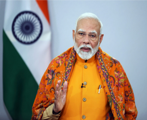
పట్టణాల్లో మౌలిక వసతుల కల్పన, మిగతా 2లో

రుణ మొత్తంలో 70% దాకా కేంద్రమే గ్యారంటీగా ఉంటుంది. చిన్న పట్టణాలకు రూ.5,000 కోట్ల నిధి నగరాలు, పట్టణాలను ఆర్థిక ప్రగతికి గ్రోత్ ఇంజన్లుగా మార్చే దిశగా కేంద్ర ప్రభుత్వం కీలక ముందడుగు వేసింది. పట్టణాల్లో మౌలిక వసతుల కల్పన, వాటి అభివృద్ధి కోసం అర్బన్ చాలెంజ్ ఫండ్ (యునీఎఫ్) ఏర్పాటు చేసింది నగరాలు, పట్టణాలను ఆర్థిక ప్రగతికి గ్రోత్ ఇంజన్లుగా మార్చే దిశగా కేంద్ర ప్రభుత్వం కీలక ముందడుగు వేసింది.