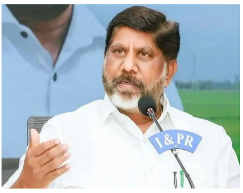
అద్భుతంగా విద్యార్థులు భావించే విధంగా ప్రభుత్వ పాఠశాలలను తీర్చిదిద్దడానికి” అని రాష్ట్ర ఉప ముఖ్యమంత్రి మల్లు భట్టి విక్రమార్క ఆకాంక్షించారు. ఖమ్మం జిల్లా మధురలోని తేళ్ల వసంతయ్య స్మారక ప్రభుత్వ ఉన్నత పాఠశాల పూర్వ విద్యార్థి సంఘం 48వ వార్షిక సమ్మేళనానికి ఆయన మిగతా 2లో

నేటి తరానికి స్ఫూర్తినిచ్చేలా పూర్వ విద్యార్థులు తమ అనుభవాలను పుస్తక రూపంలో తీసుకురావాలి “భవిష్యత్తులో ప్రభుత్వ పాఠశాలలో చదవడం మా అద్భుతంగా విద్యార్థులు భావించే విధంగా ప్రభుత్వ పాఠశాలలను తీర్చిదిద్దడానికి” అని రాష్ట్ర ఉప ముఖ్యమంత్రి మల్లు భట్టి విక్రమార్క ఆకాంక్షించారు. ఖమ్మం జిల్లా మధురలోని తేళ్ల వసంతయ్య స్మారక ప్రభుత్వ ఉన్నత పాఠశాల పూర్వ విద్యార్థి సంఘం 48వ వార్షిక సమ్మేళనానికి ఆయన ముఖ్యఅతిథిగా హాజరయ్యారు. “భవిష్యత్తులో ప్రభుత్వ పాఠశాలలో చదవడం మా