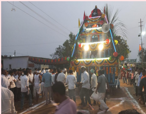
తీసుకొచ్చారు. ఈ రథోత్సవంలో గ్రామ మహిళలు ఆడుగునూ శ్రీ స్వామివారికి మంగళ హారతులతో స్వాగతం పలికి ప్రత్యేక పూజలు

ఆర్యార్థ మండల ఫిబ్రవరి 15 (హంస కలంవార్త): నిజామాబాద్ జిల్లా ఆర్యార్థ, బాల్కొండ నియోజకవర్గం లో అన్ని గ్రామాలలో, మండల కేంద్రాల్లో ఆదివారం రోజున మహాశివరాత్రి పర్వదినాన్ని పురస్కరించుకుని భక్తులు సకుటుంబ సభ్యులతో సహజంగా ఆలయాలకు వెళ్లి శివపార్వతులను దైవ దర్శనం చేసుకున్నారు. ఆయా గ్రామాలలో, మండల కేంద్రాల గ్రామాలలో శివరాత్రి రోజున భక్తుల జాగరం, దీపారాధనలు పురస్కరించుకొని ముందుగా శివాలయాల ముందు వేద పండితులచే యజ్ఞ ఛోమాలు సాయంత్రం వేళ నిర్వహించి, రథోత్సవాన్ని రంగురంగుల పూలతో పేర్చి, రథోత్సవం పై శివ పార్వతుల దేవత విగ్రహాలను పేర్చి రథోత్సవానికి తాడును కట్టి, రథోత్సవం ముందు మహిళలు మంగళ హారతులతో ఓం నమశ్శివాయ అంటూ గ్రామ ప్రజలు, గ్రామ అభివృద్ధి కమిటీ సభ్యులు, ప్రజా ప్రతినిధులు, ఆయా గ్రామాల పాలకవర్గ సభ్యులు రథోత్సవాన్ని ఆయా గ్రామాలలో ప్రధాన వీధుల ఉన్న శోభాయాత్రగా ఊరేగించి ఆలయం వరకు తిరిగి