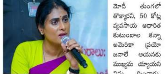
మోదీ కుంగలో కొట్టినట్లు, 50 కోట్ల వ్యవసాయ ఆదారితో కుటుంబాల కన్నా అమెరికా ప్రయోజనాలే అయినట్లు విమర్శించారు. ఏటా 100 బిలియన్ల దాకం దేశ సంపదను అమెరికాకు అప్పగించామని ఆరోపించారు. భారత ప్రధాని విదేశం ఎదుట లోగిపోవడాన్ని కాంగ్రెస్ పార్టీ తీవ్రంగా ఖండిస్తోందని తెలిపారు. ప్రధాని మోదీ వెంటనే ఈ సరెండర్ అగ్రీమెంట్ల పూర్తి వివరాలను బయటపెట్టాలని, కేవలం రెండు మూడు వస్తువులపైనే భారత అమెరికా నుంచి దిగుమతి కాబోయే అన్ని ఉత్పత్తులు, వాటిపై విధించే పన్నులు వివరాలను జాతికి తెలియజేయాలని వైఎస్ షర్మిల డిమాండ్ చేశారు.

సుంకాలు తగ్గిస్తే, వారి దిగుమతులపై మోదీ గారు సుంకాలు సున్నా చేయడం ఏంటి? మొన్నటిదాకా మన ఉత్పత్తులపై అమెరికా వేసిన పన్నులు 5 శాతం లోపే. ఇప్పుడు దాన్ని 50 శాతానికి పెంచి, అందులో 18 శాతం కుడిపై మనకు ప్రయోజనం ఎలా కలుగుతుంది? దీనిపై భారతీయ దేశ ప్రయోజనం కంటే, సున్నా సుంకాలతో అమెరికాకు 100 శాతం లాభం చేశారుకుంటే" అని షర్మిల విమర్శించారు. ఇది భారత రైతుల మేడకు ఉరిపెట్టి, అమెరికా వ్యవసాయానికి మోదీ ఇచ్చిన గ్రేడ్ డీల్ అని ఆమె మండిపడ్డారు. అభ్యర్థులు బ్రాండ్ కోసం ప్రధాని మోదీ "మేక్ ఇన్ ఇండియా" నినాదానికి తిరోధానం ఇచ్చారని షర్మిల ఆరోపించారు. "రష్యా నుంచి క్రూడ్ అయిల్ తీసుకుంటే మళ్లీ సుంకాలు 50 శాతం పెంచుతామని బ్రాండ్ బహిరంగంగా బెదిరిస్తుంటే ఇది బ్లాక్ మొయితే కాదా? ఆ భయంతోనే మోదీ సాగిలపడ్డారు." అని ఆమె వ్యాఖ్యానించారు. "నినాదానికి తిరోధానం ఇచ్చారని షర్మిల ఆరోపించారు. "రష్యా నుంచి క్రూడ్ అయిల్ తీసుకుంటే మళ్లీ సుంకాలు 50 శాతం పెంచుతామని బ్రాండ్ బహిరంగంగా బెదిరిస్తుంటే ఇది బ్లాక్ మొయితే కాదా? ఆ భయంతోనే మోదీ సాగిలపడ్డారు." అని ఆమె వ్యాఖ్యానించారు. "నినాదానికి తిరోధానం ఇచ్చారని షర్మిల ఆరోపించారు. "రష్యా నుంచి క్రూడ్ అయిల్ తీసుకుంటే మళ్లీ సుంకాలు 50 శాతం పెంచుతామని బ్రాండ్ బహిరంగంగా బెదిరిస్తుంటే ఇది బ్లాక్ మొయితే కాదా? ఆ భయంతోనే మోదీ సాగిలపడ్డారు." అని ఆమె వ్యాఖ్యానించారు.