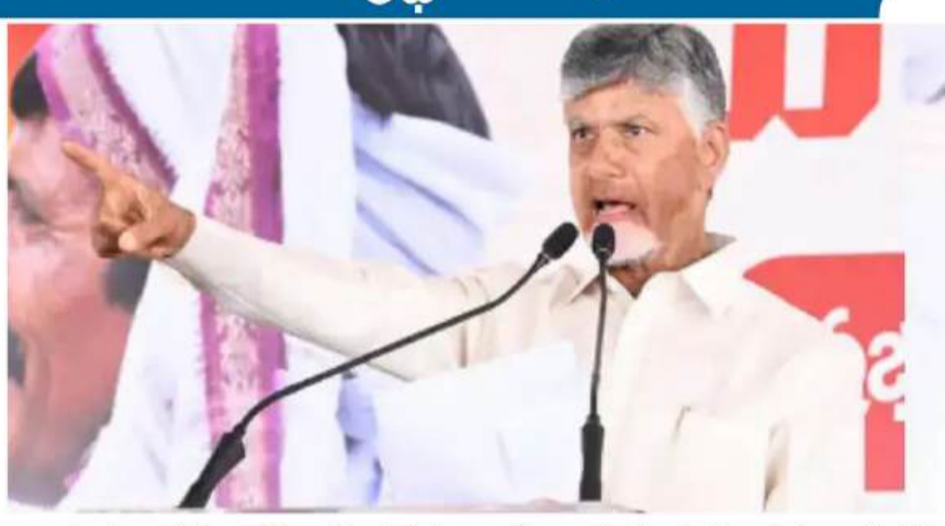
అమరావతి: వైసీపీ అధినేత జగన్ పరామర్శ యాత్రలపై సీఎం చంద్రబాబు ఎదురుదాడికి దిగారు. పరామర్శల పేరుతో గంటల తరబడి ప్రాథిక ఆపి ప్రజలను ఇబ్బంది పెట్టడం, బలప్రదర్శనలతో

ఈ తరహా రాజకీయాన్ని ఎలా ఎదుర్కోవాలి నాకు తెలుసు ★ గత ప్రభుత్వంలో పోలవరం డయాఫ్రామ్ వాల్ కొట్టుకుపోయిందని విమర్శ ★ కల్లీ న్యాయితో లడ్డా ప్రసాదం తయారు చేయించారని ఆరోపణ భవిష్యత్తులో విద్యుత్ ఛార్జీలు పెంచబోవని హామీ