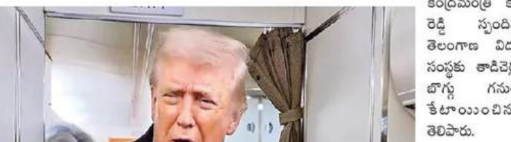
ఇరాన్ పై దాడి చేస్తే