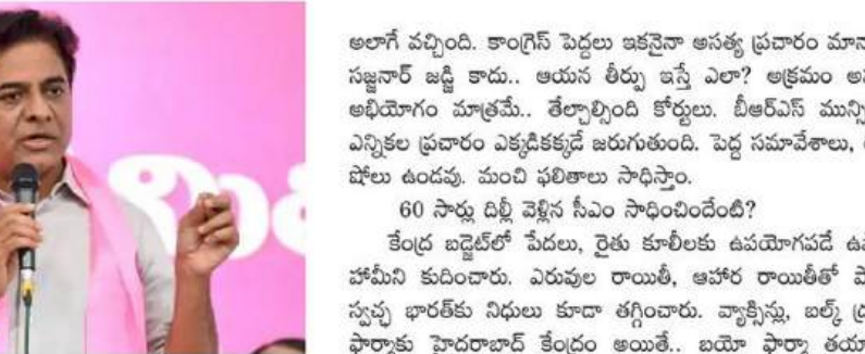
అంతసేపు కూర్చోబెట్టారు. ప్రజలకు ఒక్కోసారి అర్థమవుతున్నాయి. ఒక్కోసారి తెలియజేస్తున్నాయి. ఫోన్ ట్యాపింగ్ కేసులో మొదట్నుంచి వెలుగుతున్న అబద్ధాలు ఒక్కోసారి తెలియజేస్తున్నాయి. మొదట వ్యాపార వేళ్లు, ఆ తర్వాత సీట్ కారులు అన్నారు. ఇప్పుడు ఏమీ లేదని అంటున్నారు. ప్రభుత్వం ఇకనైనా పాలనపై దృష్టి పెట్టాలి. ఫోన్ ట్యాపింగ్ చేయాలన్న అర్థం మాత్రమే అని కేసీఆర్ స్పష్టంగా చెప్పారు. ఇవాళ రేవంట్ రెడ్డికి సమాచారం ఎలా వస్తుందో.. నాడు కేసీఆర్ ప్రభుత్వానికి కూడా

మేదారం జాతర ఏర్పాట్లలో ప్రభుత్వం విఫలమైందని చెప్పారు. దావోస్ ఒప్పందాల ద్వారా వచ్చిన పెట్టుబడులపై రాష్ట్ర ప్రభుత్వం శ్రేణిపత్రం ప్రకటించాలని డిమాండ్ చేశారు. హైదరాబాద్లో మీడియాతో ఆయన చిట్కాల్లో నిర్వహించారు. “కేసీఆర్ నందినగర్ వస్తే అధికారికంగా 900 మంది పోలీసులు పెట్టారు. అనధికారికంగా ఆ సంఖ్య అంకం ఉంటుంది. హైదరాబాద్లో పట్టణంలో కాల్పులు, దోచిదోచు పుటలు జరుగుతున్నాయి. యెక్కడా సహజ వనరుల దోచిదోచు కొనసాగుతోంది. నల్లమలపార్లమెంట్ విషయంలో తెలంగాణ ప్రయోజనాలను కాపాడుతున్నామని, రాష్ట్రానికి నష్టం జరుగుతోంది. సింగరేణి బొగ్గు కంపెనీ అంతంలో కేంద్ర, రాష్ట్ర ప్రభుత్వాల నుంచి స్పష్టమైన సమాధానం లేదు. సీమీ, సిల్గింగ్ ఇప్పటి వరకూ కోరుతుంటే ఎందుకు వెనక్కిపోతున్నారని కేంద్రమంత్రి కిషన్ రెడ్డి ఈశాన్యరైల్వే కమిటీ వేసి చేతులు దులిపేసుకున్నారు. ఈ పువ్వులలో స్వేచ్ఛలేకపోతే రేఖ బయటకు తీస్తే అన్నీ బయటకు వస్తాయి. టీఆర్ఎస్ నిలదీస్తుంటే దృష్టి మరల్చేందుకు సీట్ల పేటల విచారణలు చేస్తున్నాం. వైకాపా అసందం కోసం కేసీఆర్ను